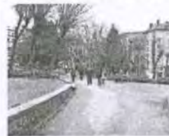
El Campillín. | FERNANDO RODRÍGUEZ